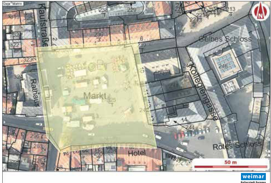
Lageplan der Verbotszone Markt