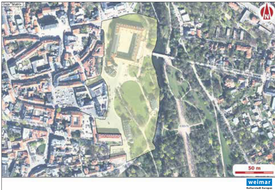
Lageplan der Verbotszone Stadtschloss