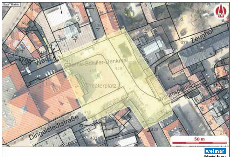
Lageplan der Verbotszone Theaterplatz